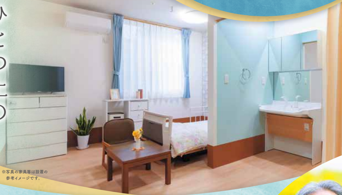
※写真の家具等は設置の参考イメージです。

住宅型有料老人ホームこすもす守山幸心は「安心」と「生きがい」を叶える暮らしをサポート。